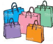
Le centre commercial