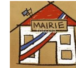
La mairie / L'hôtel de ville