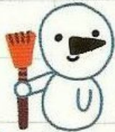
Bonhomme de neige